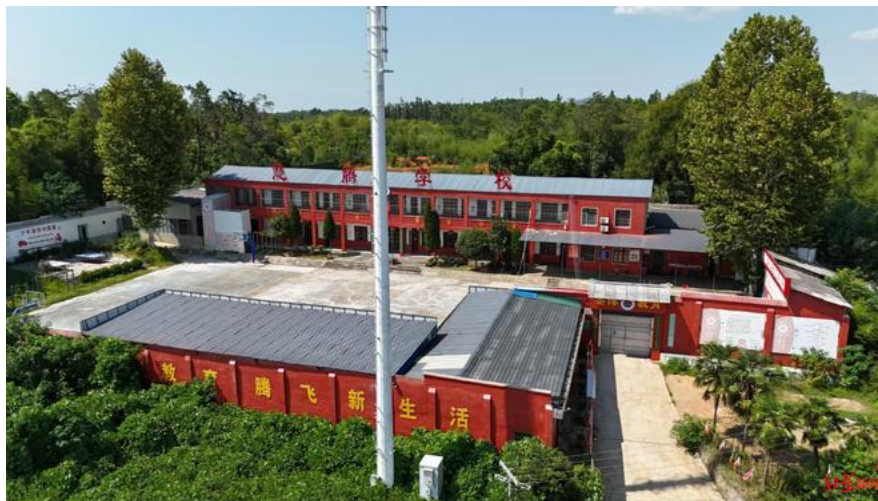
▲湖南省湘阴县圣博青少年心理成长培训学校。